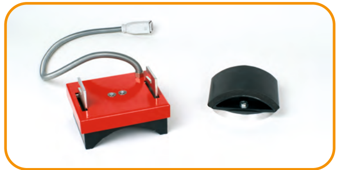
Abb. 3 - Kappenset